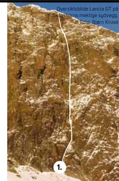
Oversiktsbilde Lancia GT på Skogshorns mektige sydvegg.

Ønderdalsdiederet ligger rett vest for avkjøringen til Hemsedal skisenter. Et trent klatreøye vil ikke unngå å få øye på denne flotte formasjonen. Kjør veien opp mot Holdeskaret og parker i svingen rett under diederet. Forholdene på denne ruta varierer veldig fra sesong til sesong. Enkelte år dekkes hele ruta av is, mens andre år får man nøye seg med litt rim her og der. Uansett forhold er Ønderdalsdiederet et lite klatreventyr som anbefales. WI 4 evt M5 en tørr vinter, 150 meter.