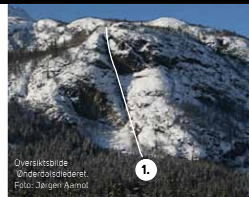
Oversiktsbilde Ønderdalsdiederet.

Av disse fossene er Grøtenutbekken den mest kjente og med sine 250 meter den lengste fossen i Hemsedal. Førstebestigningen har Henry Barber og Rob Taylor i 1979. Alle fossene på sydsiden har forholdsvis kort sesong og klatringen her avsluttes ofte i slutten av februar.