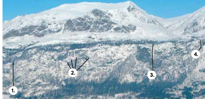
Oversiktsbilde Sydsiden.